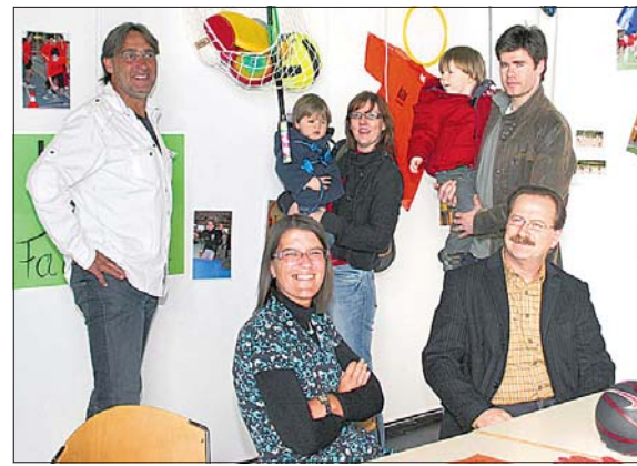
Bei der Bildungsmesse der Stadt Luxemburg wurde der Durst der Eltern nach Informationen gestillt.

Der nebenschulische Bereich bot Antworten zu Schulkantine und Beaufsichtigung der Kinder außerhalb der Schulzeiten im Rahmen der Capel-Aktivitäten, lud zu musikalischer und künstlerischer Kreativität bei Musep und „Art à l'école“ ein, während die Lasep zum körperlich-sportlichen Einsatz und gesunder Ernährung aufrief. (c.k.)